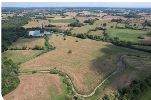
Les Prés de Ménétreuil vus du ciel