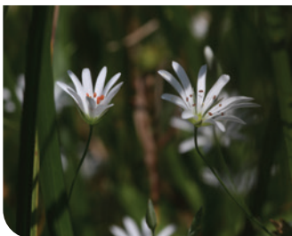
Stellaire des marais C. Foutel - CEN Bourgogne