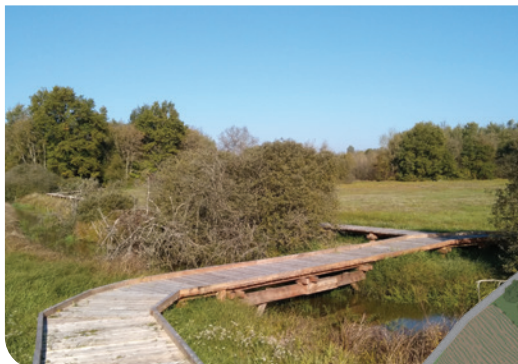
Pilotis sur la vieille Sâne G. Aubert - CEN Bourgogne

Chacun peut trouver ici un parcours à sa portée :