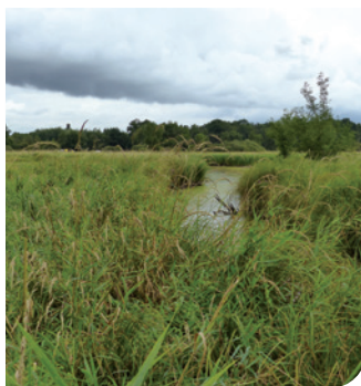
La vieille Sâne