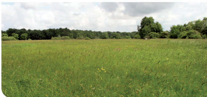
Les prairies humides C. Forest - CEN Bourgogne

Vastes prairies humides aux couleurs vives, étang, mare et ancien bras de rivière débordants de vie, haies et boisements refuges de bien des espèces et hautes herbes semblant danser au gré du vent, telles sont les multiples facettes de ce site spécialement équipé pour la découverte par tous.