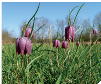
Fritillaire pintade