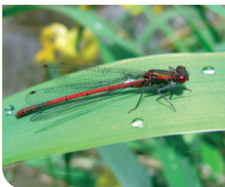
Petite nymphe à corps de feu G. Doucet - CEN Bourgogne