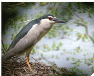
Héron bicolore M. Dumas