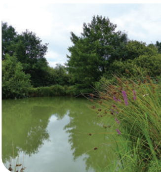
Berges de l'étang O. Girard - CEN Bourgogne

Vastes prairies humides aux couleurs vives, étang, mare et ancien bras de rivière débordants de vie, haies et boisements refuges de bien des espèces et hautes herbes semblant danser au gré du vent, telles sont les multiples facettes de ce site spécialement équipé pour la découverte par tous.